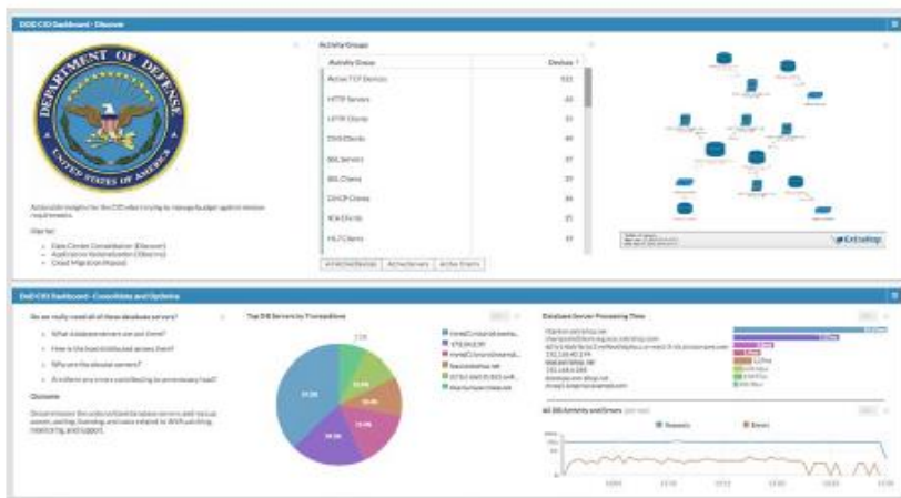
Passively discover and explore devices, ports, protocols, and services (PPS).