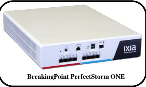
BreakingPoint PerfectStorm ONE

次世代の負荷試験装置には従来のL2~L7試験とセキュリティアタックとの同時試験が必須です!